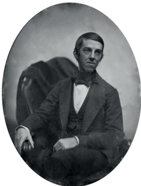
Oliver Wendell Holmes sr. (Daguerreotypie im Archiv der Harvard University)