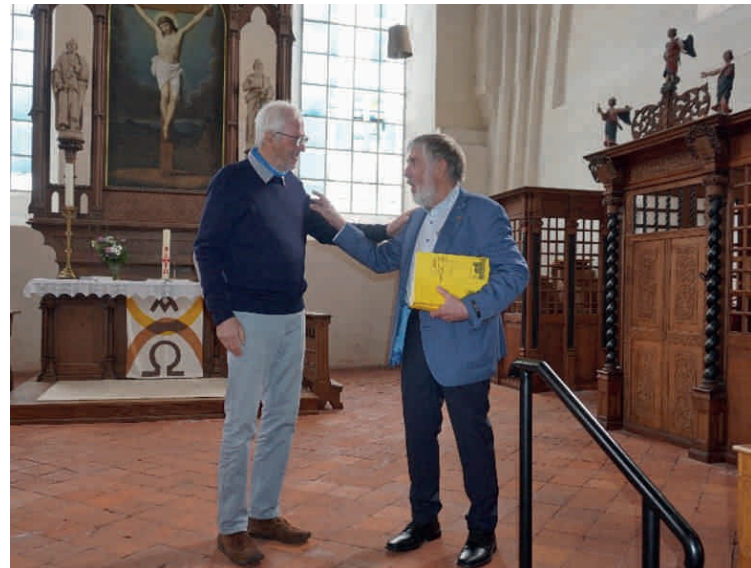
Traditionell erhielt der Autor das erste gedruckte Exemplar seines Werkes aus der Hand des Vorsitzenden.