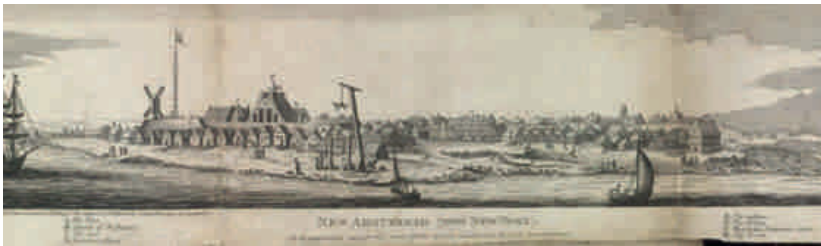
Nieuw Amsterdam. Abbildung aus Washington Irving "A History of New York" (1809)