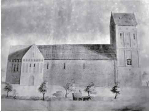
Ansicht der Osteeler Kirche vor der Verkleinerung 1830