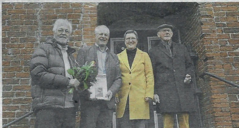
Die geschichtliche Dokumentation aus Uttum fand große Resonanz.

Diese durch viele Briefe dokumentierte Auswanderungsgeschichte wurde kürzlich in der Kirche zu Uttum der Öffentlichkeit vorgestellt. Die Upstalsboom-Gesellschaft für historische Familienforschung und Bevölkerungsgeschichte in Ostfriesland war als Herausgeber des Buches Gastgeber dieser gut besuchten Veranstaltung. Der Vorsitzende der Upstalsboom-Gesellschaft Helmut Fischer (Norden) bezeichnete das