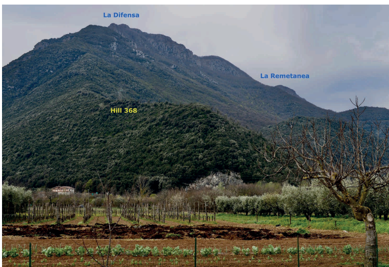
Die Nordostschulter des Monte La Difensa mit der Lokation Hill 368, Ausgangspunkt der Operation Raincoat , und der dahinter aufragende, knapp 960 Meter hohe Gipfel La Difensa. Westlich der 907 Meter hohe Remetanea.

Seine FSSF hatte inzwischen etwas südlich von Mignano Quartier bezogen und wurde dort auf den Mignano-Coup vorbereitet. Unter dem angesichts des vorherrschenden Wetters passenden Codenamen „ Operation Raincoat “ hatten alliierte Kommandeure einen verwegenen Plan entwickelt. Nicks Elitetruppe sollte dem Feind buchstäblich in den Rücken fallen; ihn also dort angreifen, wo er mit einer Attacke kaum rechnete: Über die schwer zugänglichen Steilhänge an der Nordost-Schulter des Monte La Difensa ( Hill 960 ) sollte sie die am Gipfel verschanzten deutschen Verbände der 15. Panzer-Grenadier-Division überrumpeln und dabei auch den westlich benachbarten Monte La Remetanea ( Hill 907 ) einnehmen. Hätten die Alliierten das etwa elf mal sieben Kilometer messende Bergmassiv erstmal unter ihre Kontrolle gebracht, wäre, so