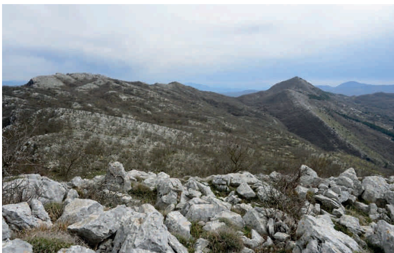
Blick vom Monte La Remetanea Richtung Südosten auf den Monte La Difensa

In den folgenden Stunden entwickelte sich ein mörderischer Kampf. Mit Browning-Maschinengewehren und Thomson-Maschinenpistolen, mit Bajonetten und Handgranaten attackierte das 1. Regiment der FSSF die deutschen Landser derart heftig, dass sich diese Richtung La Remetanea zurückzogen. Doch die FSSF ließen nicht locker und setzten nach. Vormittags um viertel vor zehn hatte sie es dann geschafft: Der vom La Difensa bis hinüber zum La Remetanea reichende Bergrücken war erobert. Zurück blieben etwa 75 getötete deutsche Soldaten. Auch 20 FSSF-Soldaten hatten ihr Leben gelassen; etwa 140 Männer waren teils schwer verwundet worden.