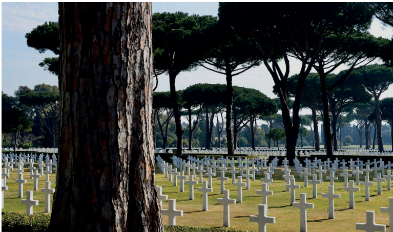
Im Juli 1956 eingeweiht: der Sicily Rome American Cemetery and Memorial.

Auf dem Gräberfeld von Nettuno herrschte eine ähnlich sonderbare Ruhe, wie ich sie auch an einem einsam in einer weitgehend leeren Landschaft wenig westlich der Moselstadt Metz stehenden Denkmal für die „ braven Krieger “ des 78. Ostfriesischen Infanterie-Regiments erfahren hatte; einem jener 144 Mahnmale, Monumente und Grabstele in der weiteren Umgebung von Metz, die an das Grauen des deutsch-französischen Kriegs von 1870/71 erinnern. – Schließlich tauchte jenes emblematische Bild vor meinem inneren Auge auf, das Käthe Kollwitz nach dem I. Weltkrieg zu Papier brachte: die Gestalt einer kämpferischen Frau, die mit hochgerecktem Arm ausruft: „Nie wieder Krieg!“ Eine scheinbar utopische Mahnung aus der Vergangenheit, die an Dringlichkeit nichts verloren hat – gerade auch mit Blick auf gegenwärtige Kriege und Konflikte.