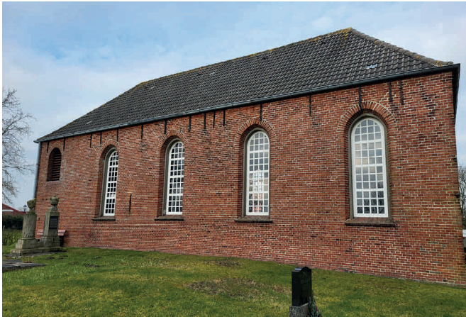
Die 1797 erbaute ev. ref. Kirche in Jarssum