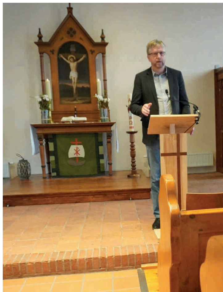
Bürgermeister Fredy Fischer überbrachte das Grußwort der Gemeinde Großheide an die Gäste der Buchvorstellung.